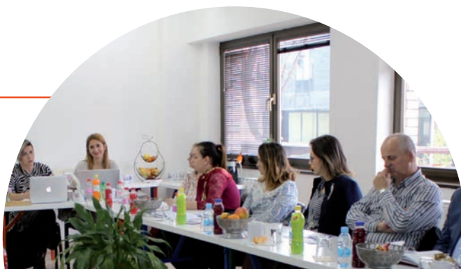
Reunión del grupo de expertos de la Fundación Comunitaria de Tuzla

Mantener una comunicación sistemática acerca de un conjunto de prioridades unificado puede ayudar a establecer colaboraciones no solo entre los donantes privados y el sector público, sino también entre otras partes interesadas pertinentes para aprovechar el conocimiento y los recursos que se requieren para lograr el cambio. El lenguaje común de los ODS resulta de gran valor en todo el proceso, desde el diálogo de partida hasta la adopción de las medidas y la elaboración de informes.