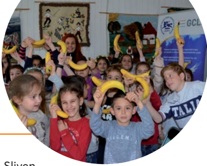
Fondo de donación comunitario Fundación Silven

Esta ayuda pueden ofrecerla las fundaciones comunitarias y las organizaciones filantrópicas comunitarias, es decir, las instituciones que aprovechan los recursos locales, pero que también canalizan el capital social y proporcionan líderes comunitarios para el cambio.