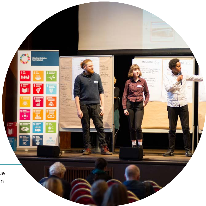
"Sustain", el primer congreso que se celebró en febrero de 2019 en Múnich.

esencial que las fundaciones comunitarias colaboren de manera urgente, ya que estas gozan de una mejor posición que cualquier otra forma de organización para establecer contactos entre los ciudadanos y otras partes interesadas a la hora de implantar la agenda, especialmente gracias a que cuentan con agentes del ámbito político, empresarial, científico y académico. Debido al carácter neutral de las fundaciones comunitarias, estas constituyen un vehículo magnífico para proporcionar una plataforma de reuniones e intercambios. Además, permiten la posibilidad de que los ciudadanos participen y contribuyan a las conversaciones y los procesos, aunque pueda parecer al principio que las puertas estén cerradas. Otra de las ventajas es que las fundaciones comunitarias están sumamente familiarizadas con sus respectivas áreas locales y poseen la agilidad necesaria para encontrar soluciones adecuadas, independientemente de lo complejos que puedan resultar los problemas.