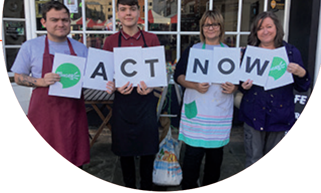
Imagen de la Red de Lucha contra la Pobreza Alimenticia de Northamptonshire participando en la semana de la campaña #EndHungerUK (Fin al hambre en RU) en noviembre de 2019.